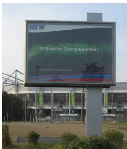
bei Dunkelheit hinterleuchtet